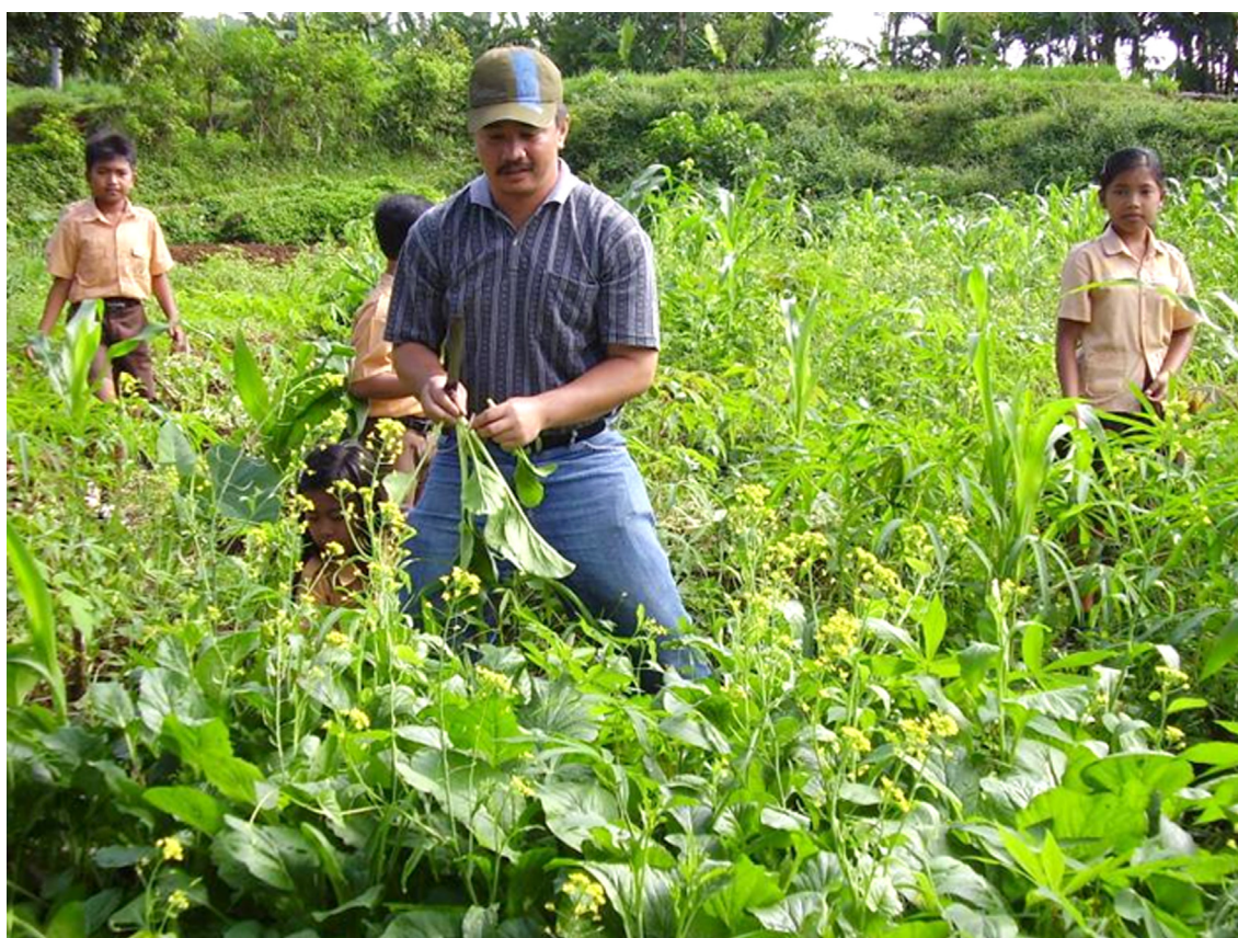
Peran serta masyarakat meningkat dalam manajemen berbasis sekolah