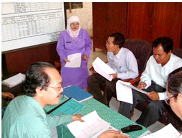
Dalam pelatihan Manajemen Berbasis Sekolah peserta pelatihan mempelajari keuangan sekolah melalui kunjungan ke sekolah

Pada pembahasan tentang MBS ini, fasilitator mendorong peserta untuk menggali dan menemukan pengertian dan ciri-ciri MBS melalui diskusi, pameran, observasi materi audio visual, dan memformulasikan simpulan tentang MBS dari serangkaian kegiatan di atas. Setelah memahami keunggulan MBS diharapkan sekolah menerapkan MBS.